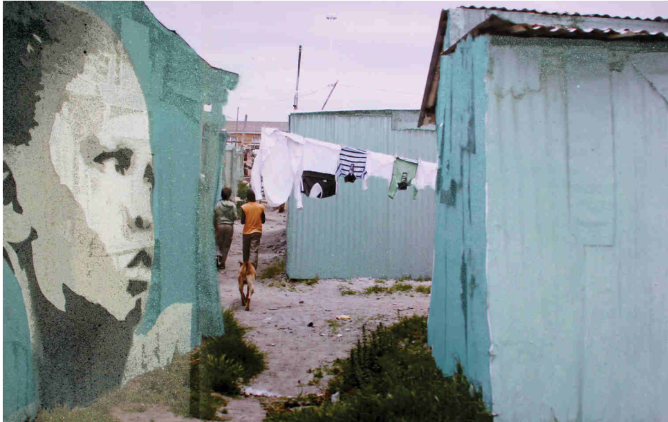
Township 002, Collage: Sprühlack auf Photoausdruck