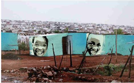
Township 005, Collage: Sprühlack, Marker auf Photoausdruck