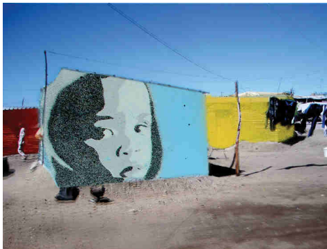
Township 001-1, Collage: Sprühlack auf Photoausdruck