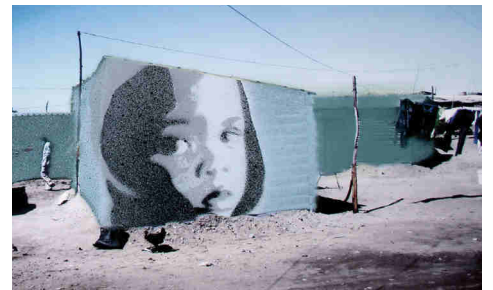
Township 001-4, Collage: Sprühlack auf Photoausdruck