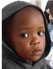
Portrait eines Kindes