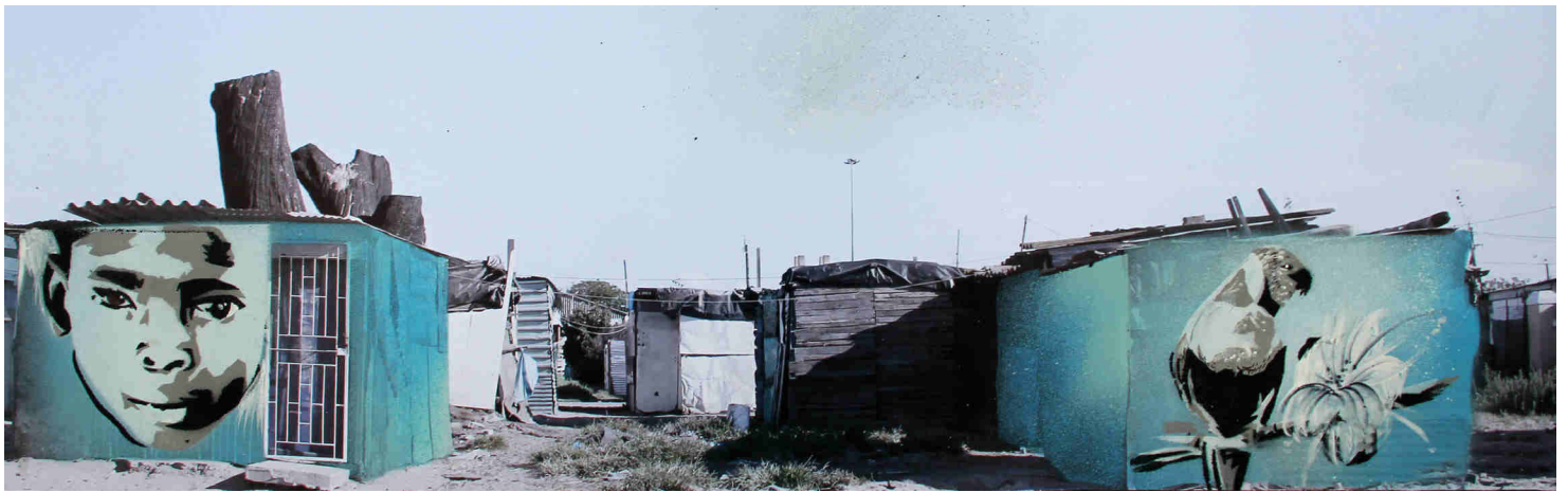
Township 006, Collage: Sprühlack, Marker auf Photoausdruck