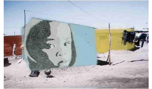
Township 001-1, Collage: Sprühlack auf Photoausdruck