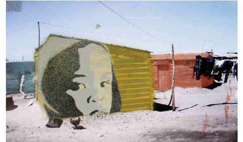
Township 001-3, Collage: Sprühlack auf Photoausdruck