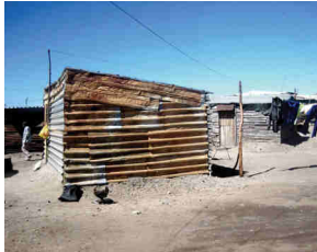
Shack im Township Waterworks